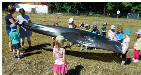
Der schwarze Ballon stieg tatsächlich in die Luft!